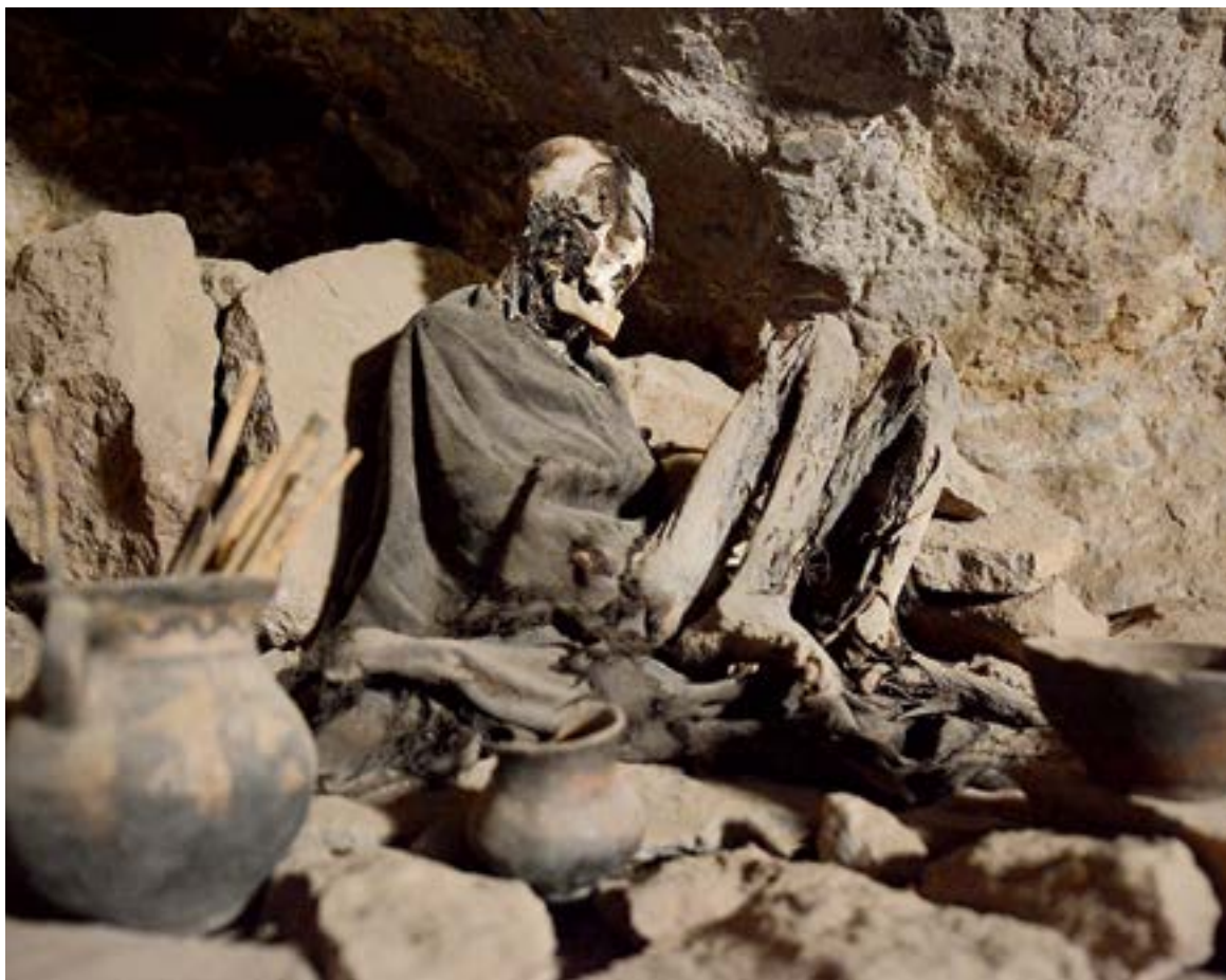
← Zaledněná sopka Sajama se tyčí nad stejnojmennou vesnicí s typickým kostelíkem. ↑ Volně přístupné mumie v malé jeskyni při úpatí sopky Tunupa na okraji slané pánve Salar de Uyuni. ↓ Nekonečný prostor Altiplana s mělkou lagunou a plameňáky.