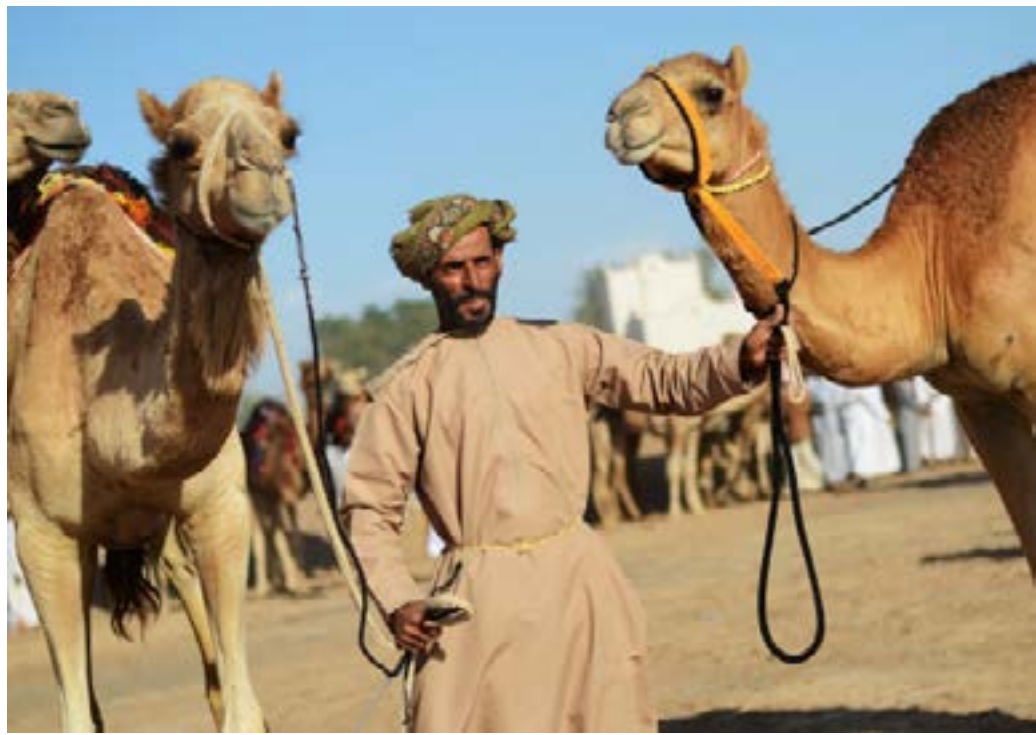
Závody v Ománu nejsou výhradně mužskou záležitostí.