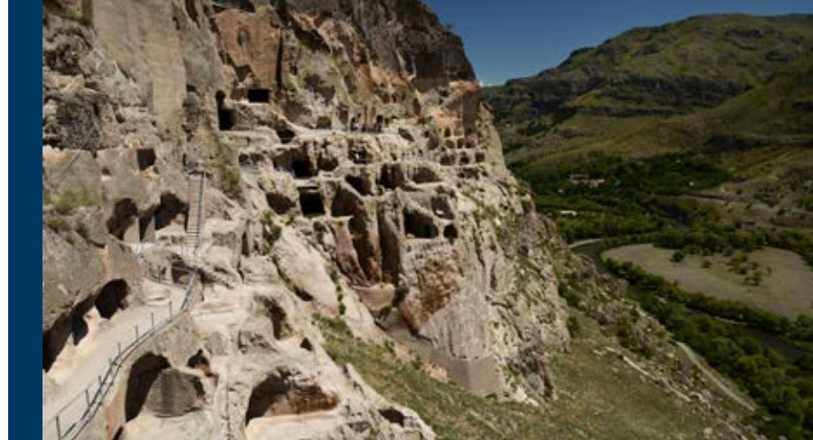
[A] Skalní město Vardzia.