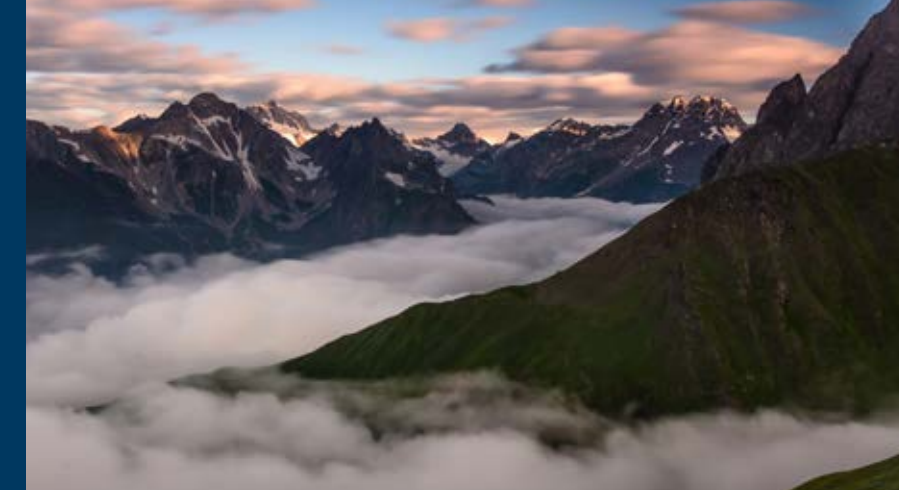
[text & foto: Pavel Svoboda, www.photo-svoboda.cz]