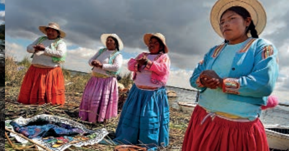
[ptal se: Jan Miklín]